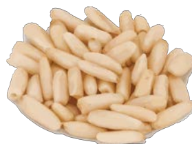
pine nut صَنَوْبَر