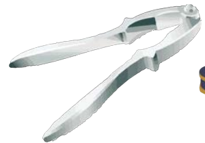
nutcracker كَسَّارَةُ الْبُنْدُق