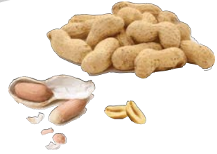
peanut الْفُؤْلِ السُّودَانِي