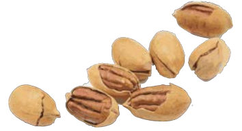
pecan جَوَزِ الْبِقَان