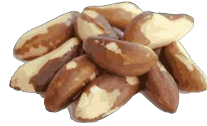
Brazil nut جَوَزِ بَرَاذِيلِيَّة