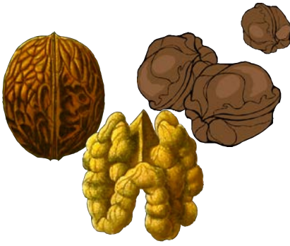
walnut جَوَز / عَيْنِ الْجَمَل