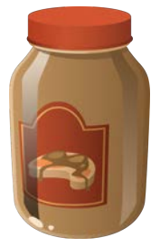
peanut butter زَبْدَةُ الْفُؤْلِ السُّودَانِي