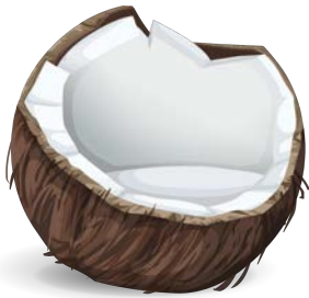
coconut جَوَزِ الْهِنْد